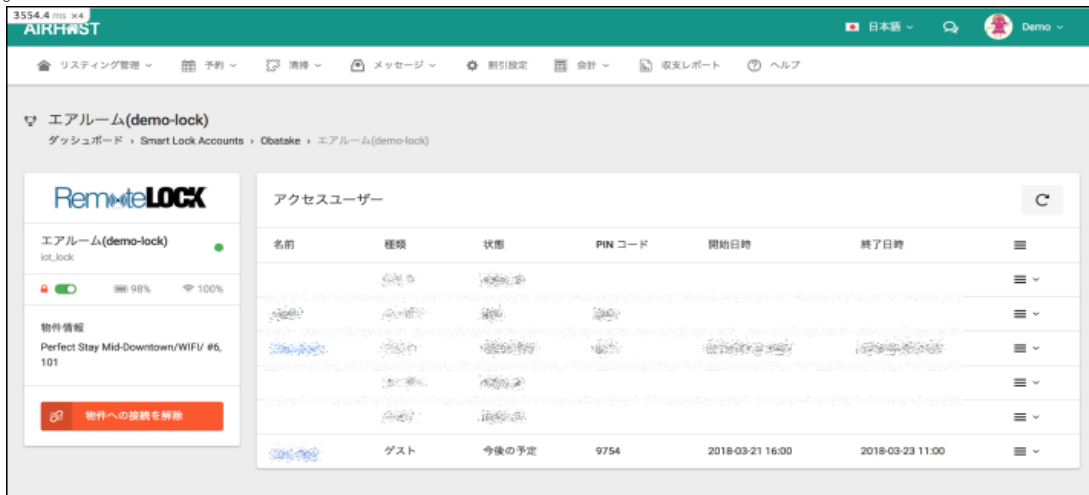
図 2 : AirHost PMS 利用イメージ

2) 複数の宿泊予約サイトを利用する場合も、AirHost PMS のサイトコントローラ機能がダブルブッキングを確実に防ぎます。予約が確定すると、AirHost PMS がチェックイン・アウトの日付で PIN コードを自動的に生成します。また、予約延長やキャンセル時にも自動で PIN コードを更新・キャンセルします。