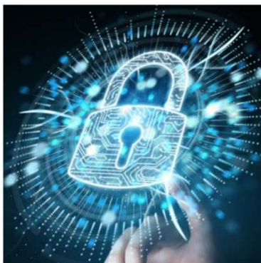
「サイバーセキュリティ」(イメージ) (「標的型サイバー攻撃」がどのように行われるのかを実際にPCを用いて示します。)

当社技術の活用範囲や可能性を感じていただく5つの体感展示を用意しています。「サイバーセキュリティ」の展示では、近年台頭する「標的型サイバー攻撃」の一連の流れを体験できます。また、「ジオラマ × シミュレーション解析」と称した展示では、津波が発生した際の避難について「自転車避難」の有効性をシミュレーションで示します。「ビールの泡解析」では、流体力学と粉体工学を用いたシミュレーションで、注ぐ回数によって生成される泡の大きさがどのように変化するかを示し、おいしいビールの注ぎ方を解明します。展示の詳細は順次、公式WEBサイトにて公開予定です。