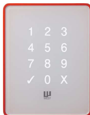
タッチパネル式のテンキー