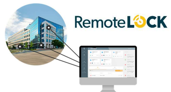
クラウドで遠隔管理