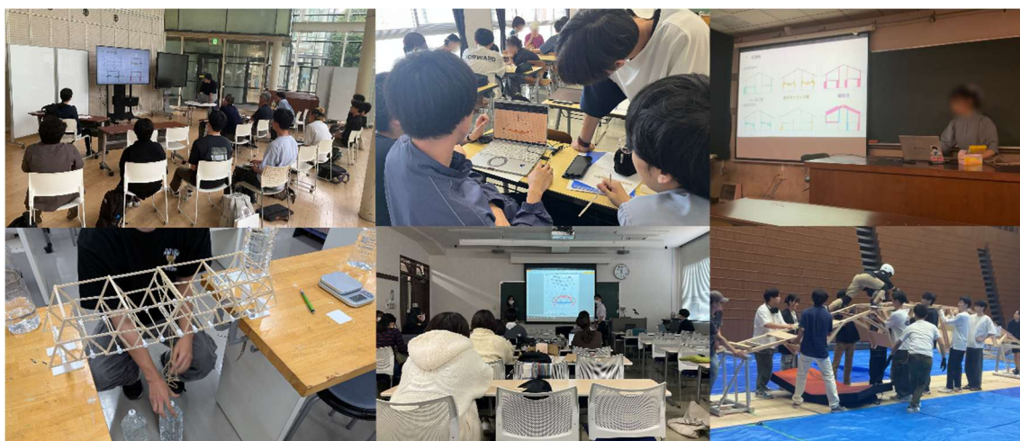
図2 「MystructureNote」を活用した教育実践の様子

日本建築学会受賞概要： https://www.aij.or.jp/2026/2026prize.html