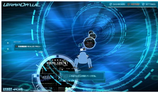
図 2 Web 閲覧履歴の可視化