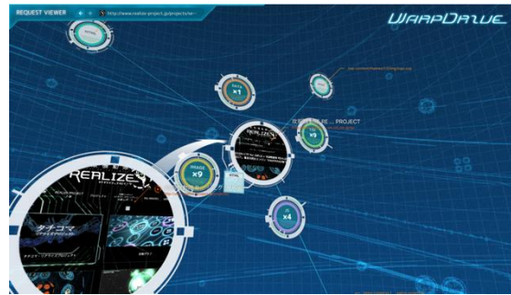
図 3 Web コンテンツの可視化