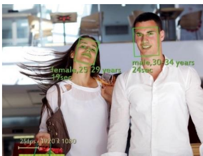
図1 性別・年齢情報の計測イメージ

※カメラ画像は録画せず、計測された数値データのみ保存するもので、来店者個人を特定するものではありません。 ※クラウド・サービスのため既存ユーザー様も簡単な手続きで新機能をご利用いただけます。